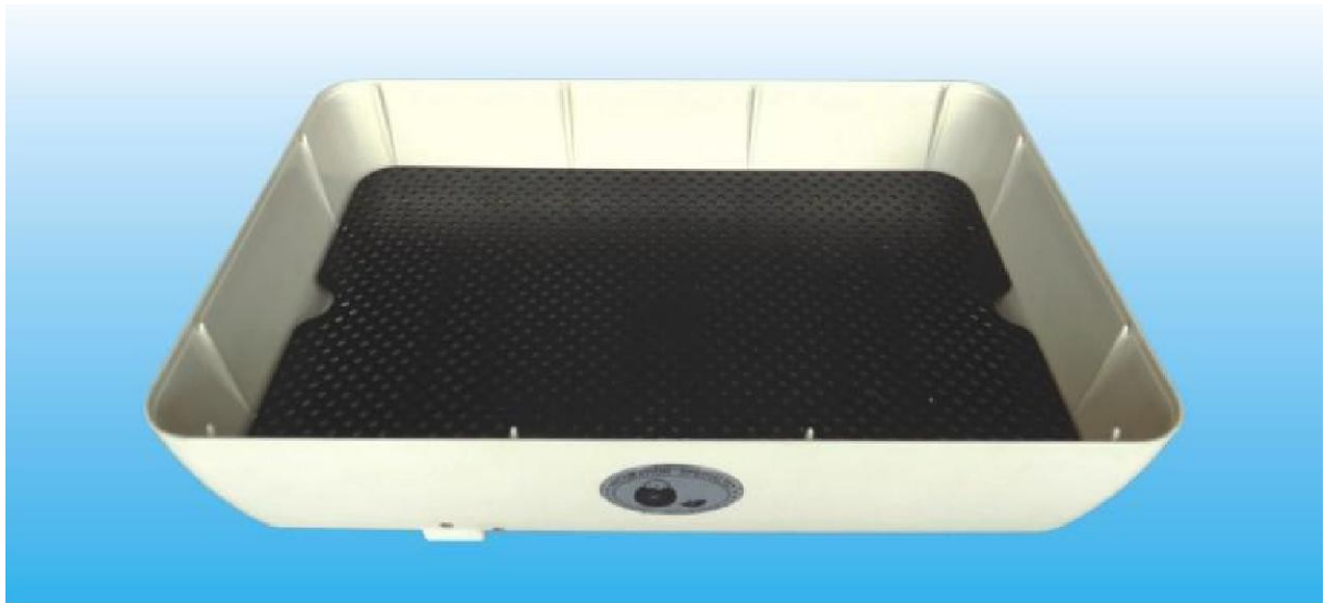
Obrázek 2: Perforovaná podlážka

Doporučujeme do líhně vložit vlastní vlhkoměr a vlhkost sledovat.